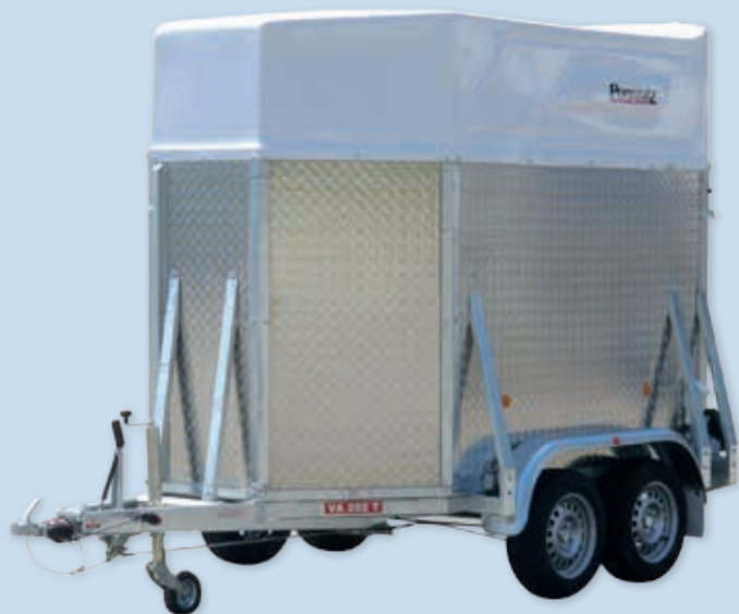
Abb.: Sonderausstattung VA 282 T-AL mit Polydach und Verkleidung aus Alu-Riffelblech