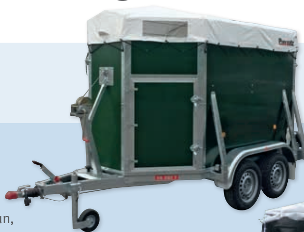
Abbildung mit Windenstand, Seilwinde und Schautüre