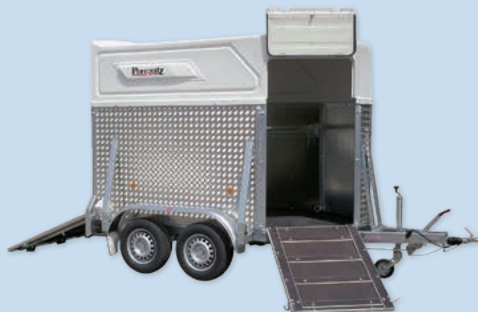
Abb.: Sonderausstattung VA 145 T-AL mit Polydeckel und Gummibodenestrich