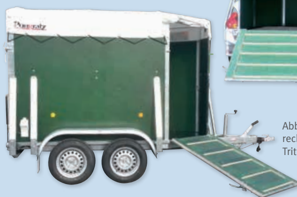
Abb.: Viehausstieg rechts vorne mit Trittleiste