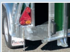
Abb.: Multifunktionsleuchte, Hebehilfe und Verschlussystem für hintere Bordwand